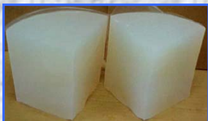
完全な混合と気泡のない仕上がり