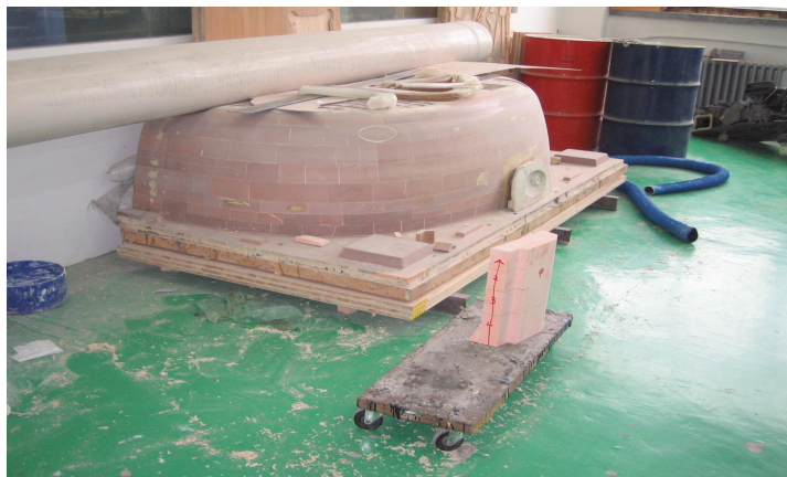
(マスターモデル サンモジュール TW)