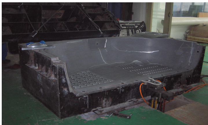
(凹型：大連聖天高分子技術有限公司製作)