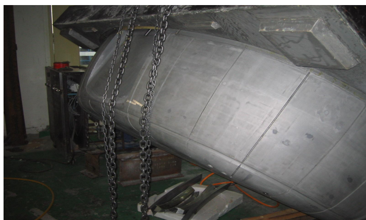
(凸型：大連聖天高分子技術有限公司製作)